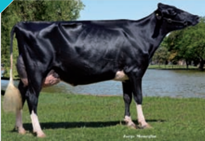
76 DANUBIOS MELODY ALEXANDER TEI

HBA 0315047 Campeón Vaca 4 Años y Rdo. Gran Campeón La Playosa, Rdo. Campeón Vaca 4 Años ERICCA, Campeón Vaca 4 Años, Gran Campeón y Mejor Ubre FINACO y Sunchales, Rdo. Campeón Vaca 4 Años y 3er. Mejor Hembra San Francisco, Campeón Vaca 4 Años y 3er. Mejor Hembra MIL. Criador: C. Leiggener, expositor: Cab. y Tamb. La Lilia SA y C. Leiggener.