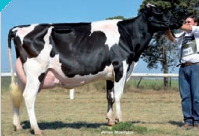
74 LA LILIA AGOSTINA HERMINIA MESSI

HBA 0314973 Campeón Vaca 3 Años Senior La Playosa, Campeón Vaca 3 Años Senior y Campeón Vaca Joven ERICCA, Campeón Vaca 3 Años Senior y Mención Vaca Joven FINACO, Campeón Vaca 3 Años Senior y Rdo. Campeón Vaca Joven Bavio. Criador y expositor: Cab. y Tamb. La Lilia SA , La Lilia.