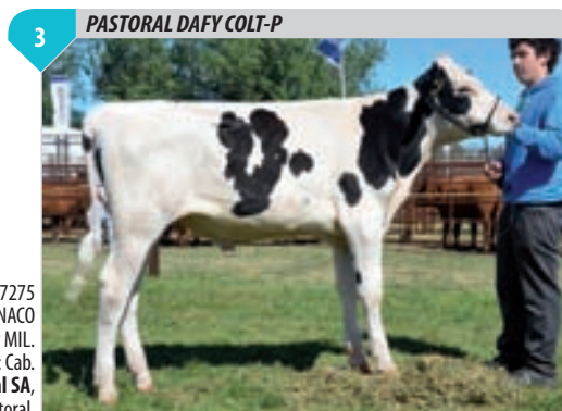
HBA 257275 Campeón Ternero FINACO y MIL. Criador y expositor: Cab. La Pastoral SA , La Pastoral.