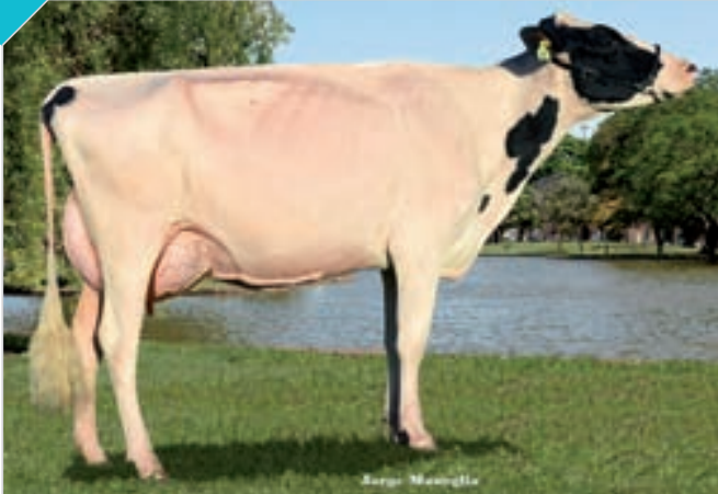
61 SAN SATURIO SHEILA CHELIOS