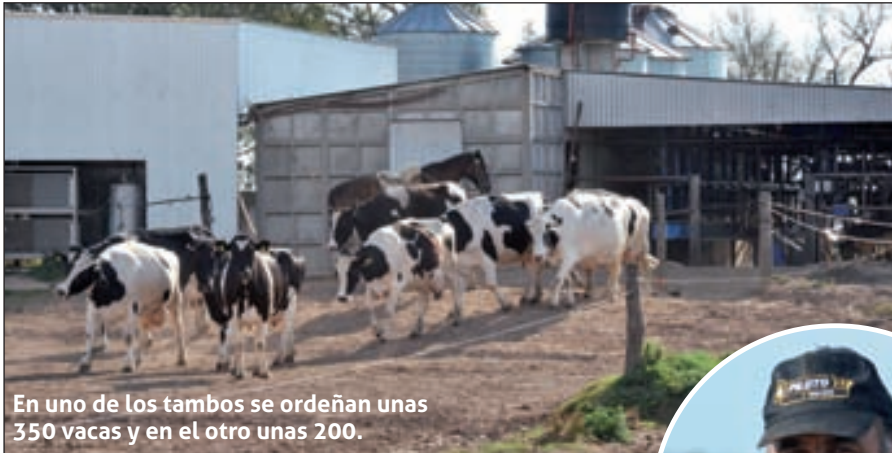
En uno de los tambos se ordeñan unas 350 vacas y en el otro unas 200.