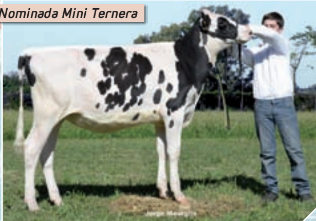
Nominada Mini Ternera

Mostrando un plan genético que está comenzando a dar sus frutos