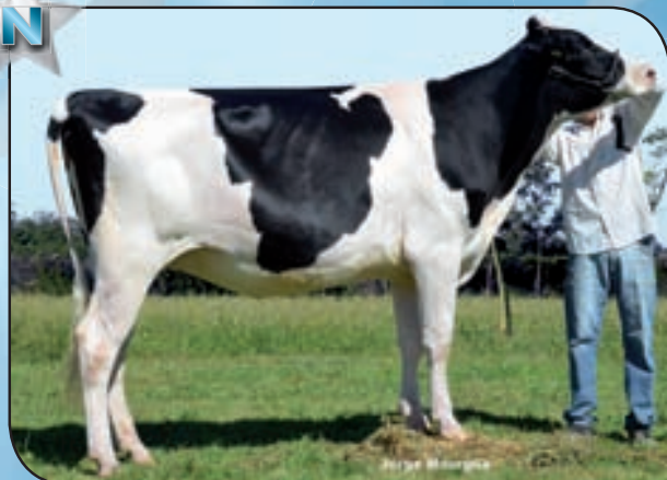
SAN SATURIO BRIGIDA SID Campeón Vaquillona Mayor y Rdo. Campeón Hembra Junior FINACO