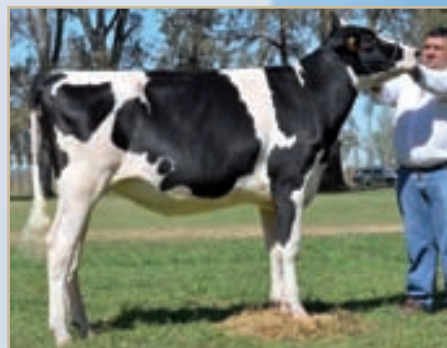
Campeón Ternera Menor y Rdo. Campeón Hembra Junior Villa María otoño, Campeón Ternera Intermedia y Rdo. Campeón Hembra Junior Canals, Campeón Ternera Mayor y Rdo. Campeón Hembra Junior ERICCA, Campeón Ternera Mayor MIL.

Hacemos llegar a todo nuestro personal, a criadores, tamberos y clientes los más grandes deseos de felicidad y prosperidad en este nuevo año.