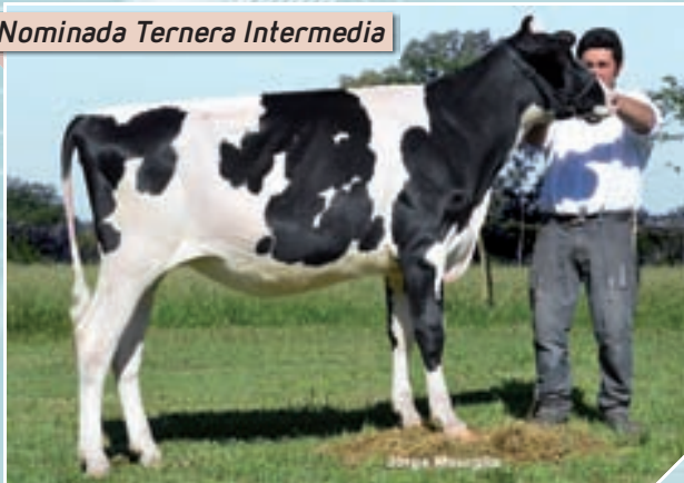
Nominada Ternera Intermedia

Rdo. Campeón Ternera Juvenil Mercoláctea; Campeón Ternera Menor Rafaela; Campeón Ternera Menor y Campeón Hembra Junior La Playosa; Campeón Ternera Intermedia y Campeón Hembra Junior FINACO y Sunchales; Rdo. Campeón Ternera Intermedia MIL.