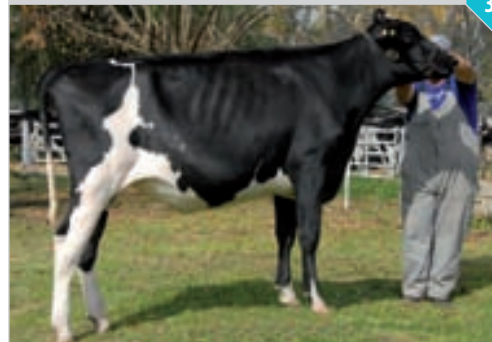
MAYGA 5652 ELISA 5362 DEMPSEY 38

HBA 0324726 Campeón Ternera Mayor Fiesta Nac. del Holando. Criador y expositor: Lorento SA, Alicia.