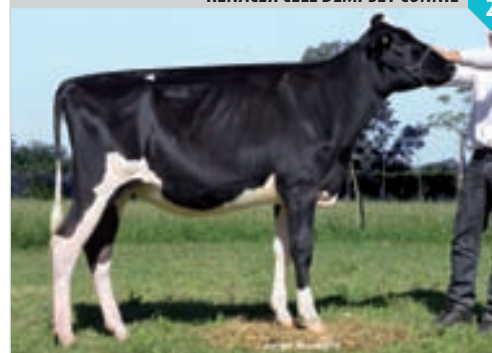
RENACER CELE DEMPSEY CONNIE