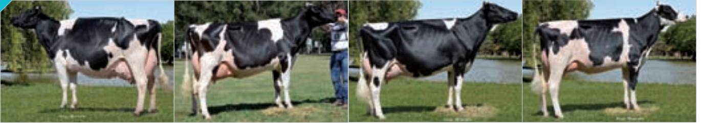
Conjunto Mejor Criador FINACO. Criador: Cab. y Tamb. La Lilia SA , La Lilia.

108 Integrado por RP 3095, RP 3866, RP 4067, 4535