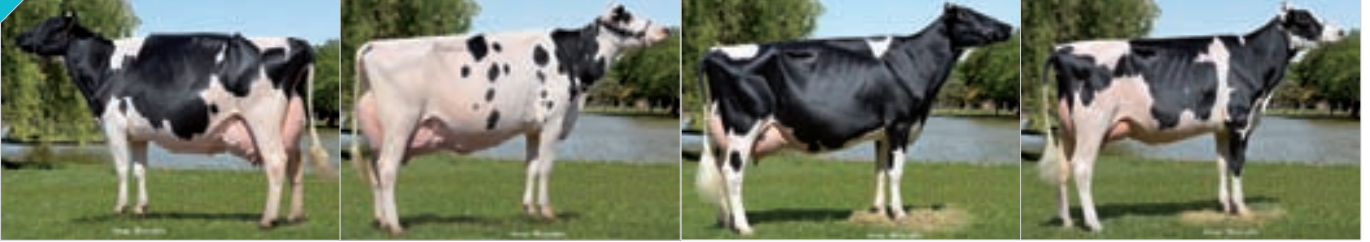
Conjunto Mejor Criador Canals. Criador: Cab. y Tamb. La Lilia SA , La Lilia.

107 Integrado por RP 3099, RP 3866, RP 3336, 4535