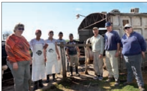
Una de las razones del éxito es el trabajo en conjunto entre los cuatro integrantes de la familia y los responsables del tambó.

El tambó forma parte de la entidad de Control Lechero Oficial