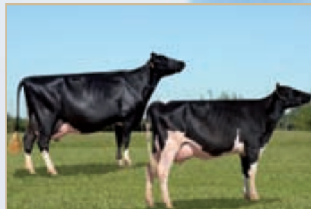
Conjunto Campeón Canals y ERICCA.

DON MINGO FURLA 2218 DEI LOU TE y DON MINGO ARA LOU 2576 WINDBROOK TE