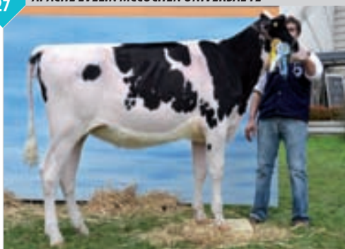
APACHE EVELIN MCCUCHEN UNIVERSAL TE