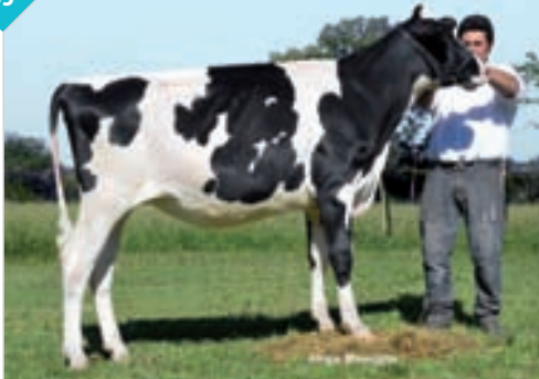
35 RENACER EMMA SID ESCONDIDA TE