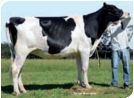
SAN SATURIO BRIGIDA SID

Expositor: Mundo Gen y Claudio Andreoli.