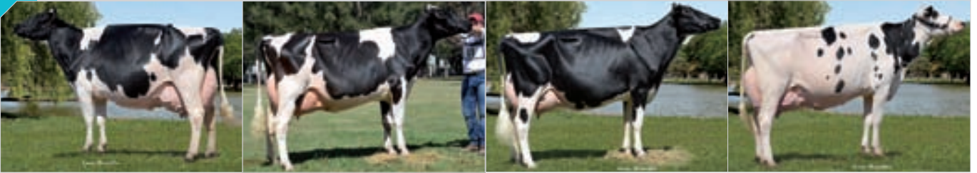
Conjunto Mejor Expositor La Playosa, ERICCA y San Francisco. Expositor: Cab. y Tamb. La Lilia SA , La Lilia.

114 Integrado por RP 3095, RP 3866, RP 3336, 4067