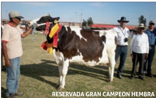
RESERVADA GRAN CAMPEON HEMBRA