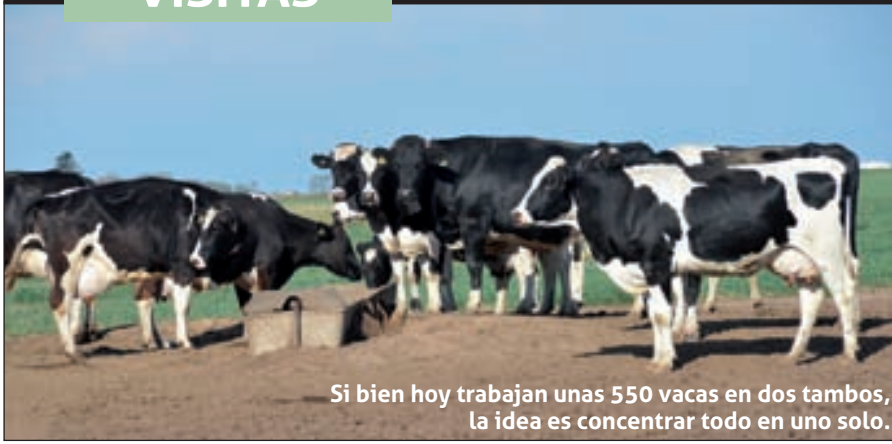
Si bien hoy trabajan unas 550 vacas en dos tambos, la idea es concentrar todo en uno solo.