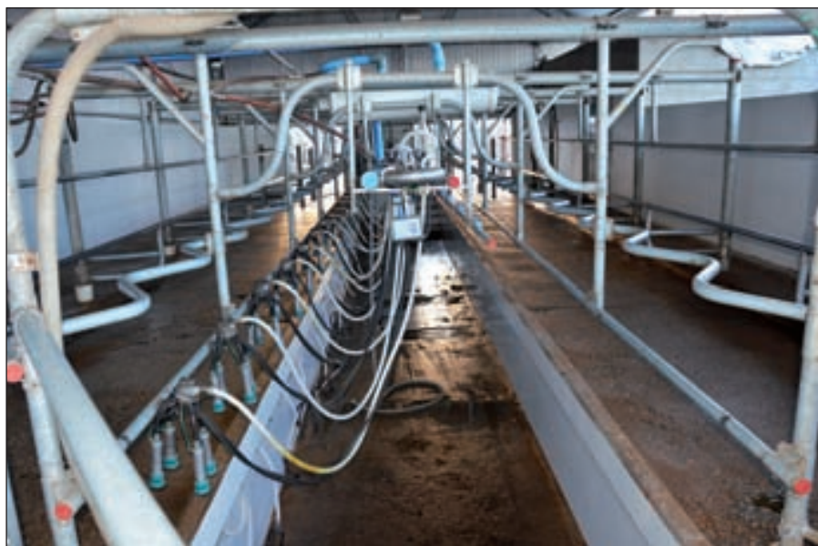
La producción, a mediados de septiembre, estaba en unos 9 mil litros, con un promedio de 24 litros vaca/año.

debe a que usamos una ración bien balanceada.