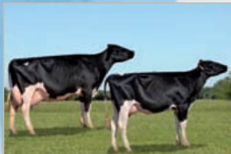
Conjunto Campeón La Playosa.

DON MINGO LLUVIA 259/T 1080 y DON MINGO MARSHALL DESI 1724 REGINALD