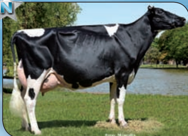
LA LILIA BABY ANGIE JASPER TE Rdo. Campeón Vaca 4 Años Canals, Bavio y MIL, Campeón Vaca 4 Años, Gran Campeón y Mejor Ubre ERICCA y San Francisco, Campeón Vaca 4 Años y 3er. Mejor Hembra Rafaela. En copropiedad con Cab. y Tamb. La Lilia SA.