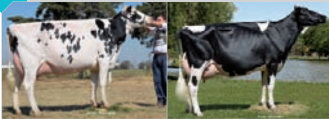
Integrado por LA LILIA ILUSTRADA ANGIE BLITZ TE y LS LILIA BABY ANGIE JASPER TE. Progenie de madre La Playosa . Expositor: Cab. y Tamb. La Lilia SA , La Lilia.