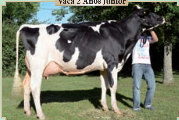
CAMPAZU ROSAN 3422 ATWOOD

Rdo. Campeón Vaca 2 Años Senior Bavio y Brandsen.