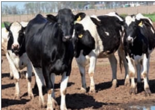
El encierro de las vaquillonas les permitió adelantar los servicios llevándolos a los 14 meses.