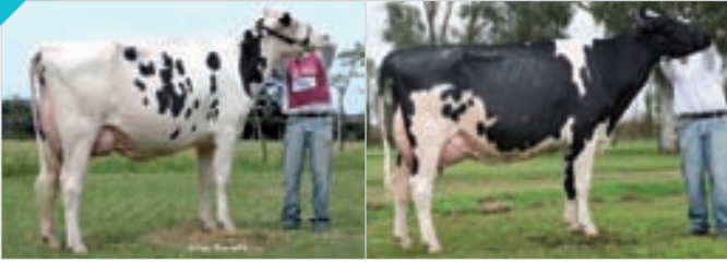
Conjunto Madre-Hija Palermo y Rafaela. Expositor: G. Miretti e Hijos , La Luisa.

100 GAJC LATINA SHOTTLE LICORICE TE y GAJC LOIRA BOOKEM LATINA TE