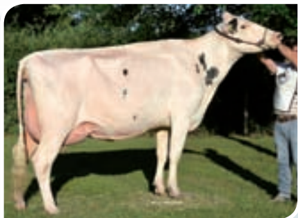
SAN SATURIO MARIS BAXTER TEI