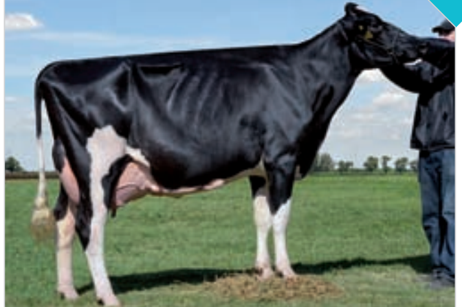
NININ SALTARINA LOU ROY