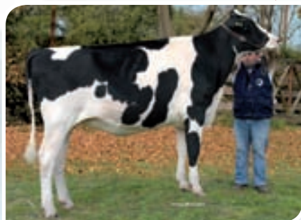
SAN SATURIO SEGOVIA ATWOOD TE