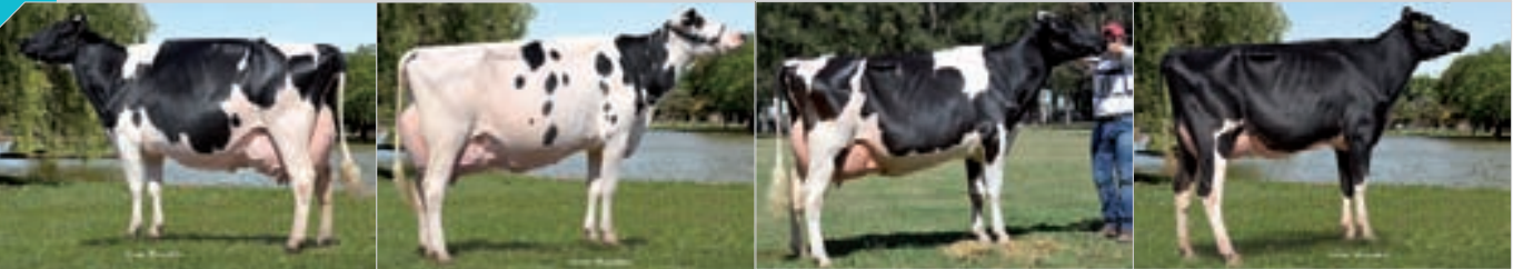
Conjunto Mejor Expositor ML. Expositor: Cab. y Tamb. La Lilia SA , La Lilia.

115 Integrado por RP 3095, RP 4476, RP 3336, 4067