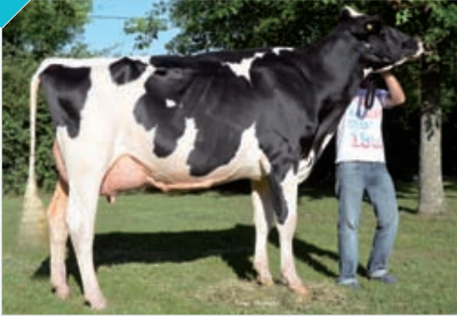
HBA 0327949 Rdo. Campeón Vaca 2 Años Senior Bavio y Brandsen. Criador y expositor: Campazú SA , Campazú.