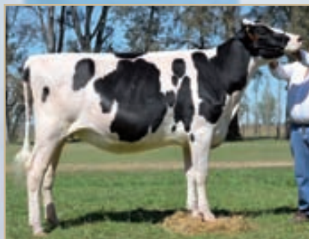
Campeón Vaquillona Menor Villa María otoño, Campeón Vaquillona Intermedia Canals, La Playosa, ERICCA y MIL.