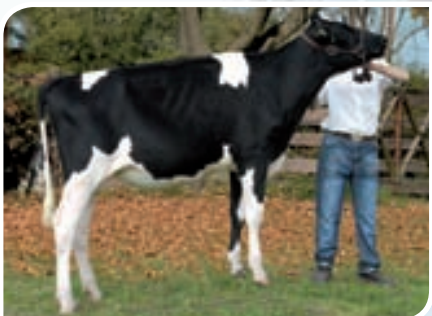
SAN SATURIO LUXMI SHADOW 332 TE