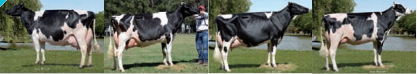
Conjunto Mejor Expositor FINACO. Expositor: Cab. y Tamb. La Lilia SA , La Lilia.

113 Integrado por RP 3095, RP 3866, RP 4067, 4535