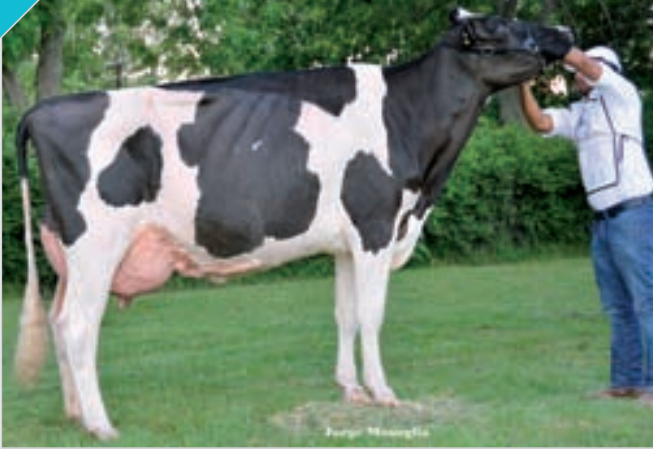
72 CAMPAZU MANDATARIA 1048 JAYZ TE

HBA 0319458 Campeón Vaca 3 Años Senior y Campeón Vaca Joven Palermo, Rdo. Campeón Vaca 3 Años Senior Rafaela y Bavio, Rdo. Campeón Vaca 4 Años y Rdo. Gran Campeón Brandsen. Criador y expositor: Campazú SA , Campazú.