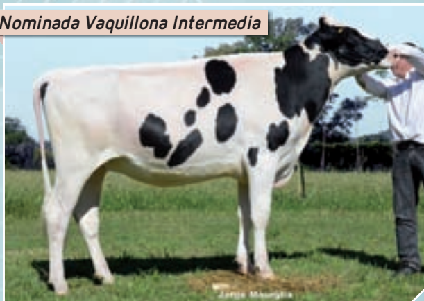
Nominada Vaquillona Intermedia

Campeón Ternera Menor Mercoláctea; Rdo. Campeón Ternera Intermedia Rafaela; Campeón Ternera Mayor FINACO y Sunchales; Rdo. Campeón Ternera Mayor MIL.