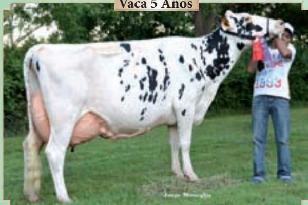
CAMPAZU ZUMA HONEY 1636 BAXTER

Rdo. Campeón Vaca 5 Años Bavio y Brandsen.