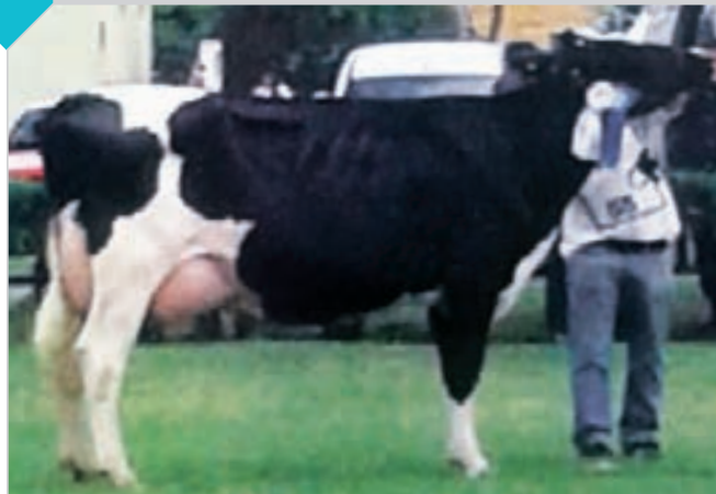
71 CENTENNIAL GOLDWYN 946 DOLMAN TE