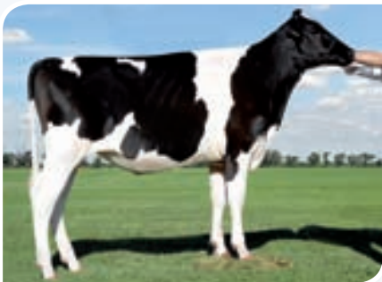
SAN SATURIO CANDELARIA MERIDIAN TE