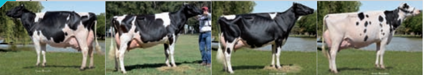
Conjunto Mejor Criador La Playosa, ERICCA, San Francisco y ML. Criador: Cab. y Tamb. La Lilia SA , La Lilia.

109 Integrado por RP 3095, RP 3866, RP 3336, 4067