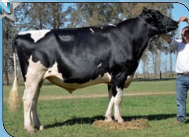
JUCARAS BONOBON BONITA MANIFOLD ¡Invicto! Campeón 2 Años Menor y 3er. Mejor Toro Villa María otoño, Campeón 2 Años Menor La Playosa, Campeón 2 Años Menor y Gran Campeón ERICCA, Campeón 2 Años Mayor MIL.