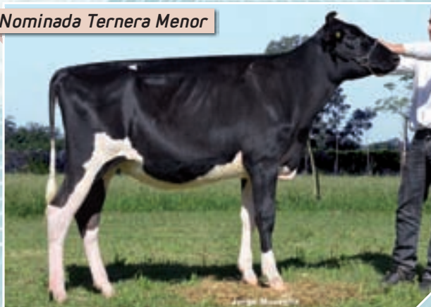
Nominada Ternera Menor