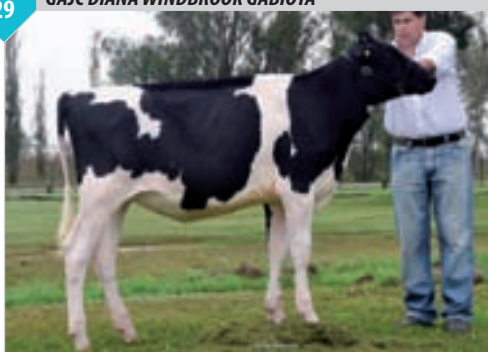
GAJC DIANA WINDBROOK GABIOTA