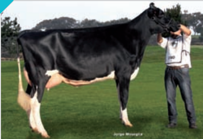
63 CENTENNIAL DOLMAN 1120 ALEXANDER

HBA 0318754 Rdo. Campeón Vaca 2 Años Senior Mercoláctea. Criador y expositor: Centennial SA , Centennial.