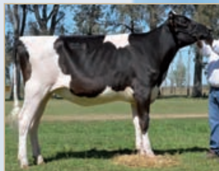
Campeón Ternera Intermedia Villa María otoño, Campeón Ternera Mayor Canals y La Playosa, Campeón Vaquillona Menor y Campeón Hembra Junior ERICCA, 3er. Premio Vaquillona Menor MIL.