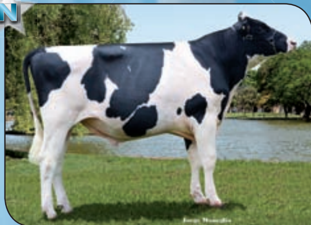
LA LILIA TIGRE FAMOSA ATWOOD TE ¡Invicto! Campeón Junior Mayor y Gran Campeón Canals, La Playosa, Sunchales, FINACO, San Francisco y MIL, Campeón Junior Mayor y Rdo. Gran Campeón ERICCA.