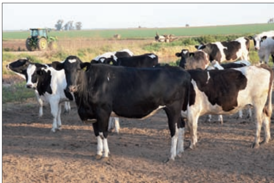
Las terneras reciben hasta 150 kilos de rollo a discreción, para luego sumarles maíz con un concentrado proteico, sin quitarles el suero, hasta que llegan a los 230 kilos.