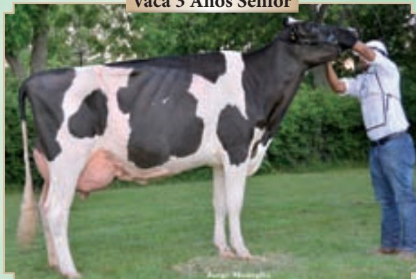
CAMPAZU MANDATARIA 1048 JAYZ TE

Campeón Vaca 3 Años Senior y Campeón Vaca Joven Palermo, Rdo. Campeón Vaca 3 Años Senior Rafaela y Bavio, Rdo. Campeón Vaca 4 Años y Rdo. Gran Campeón Brandsen.