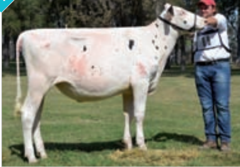
31 LA LILIA TORMENTA MIREIA MCCUCHEN TE

HBA 0325401 Rdo. Campeón Ternera Menor Rafaela, La Playosa, Campeón Ternera Menor Canals, FINACO, Campeón Ternera Menor y Rdo. Campeón Hembra Junior San Francisco y Bavio. Criador y expositor: Cab. y Tamb. La Lilia SA, La Lilia.