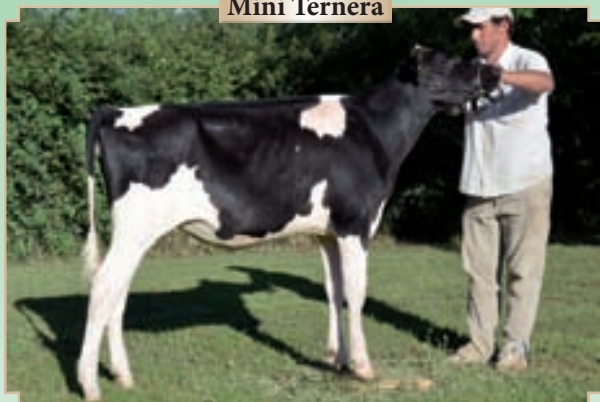
CAMPAZU CRESTY 2954 HERO