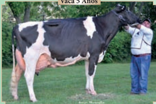
CAMPAZU DEDALITA 2380 MR BURNS

3er. Premio Vaca 5 Años Palermo, Rdo. Campeón Vaca 5 Años Rafaela, Campeón Vaca 5 Años Bavio y Brandsen.