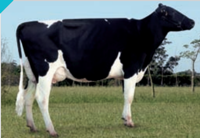
69 MARKAB KATRINA SANCHEZ ½ POLLY TEI