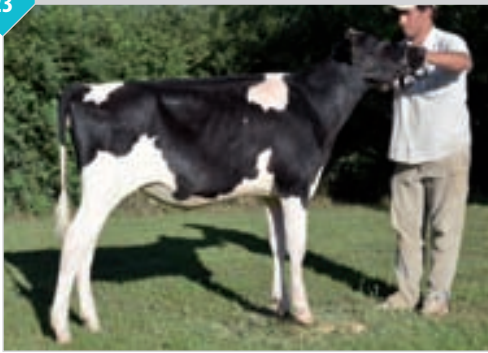
CAMPAZU CRESTY 2954 HERO

HBA 0327387 Campeón Ternera Juvenil Brandsen. Criador y expositor: Campazú SA , Campazú.