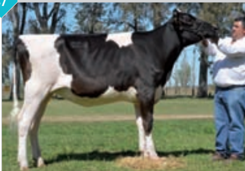
37 DON MINGO IRA GRAZIA 2376 SEAVER TE

HBA 0326682 Campeón Ternera Intermedia Villa María otoño, Campeón Ternera Mayor Canals y La Playosa, Campeón Vaquillonona Menor y Campeón Hembra Junior ERICCA, 3er. Premio Vaquillonona Menor MIL. Criador y expositor: Sy C Tambos SA, Don Nura.