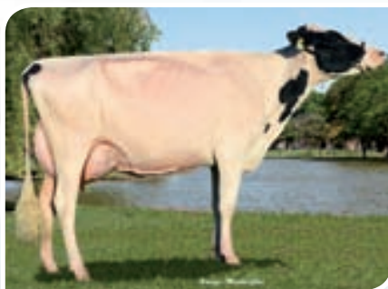
SAN SATURIO SHEILA CHELIOS