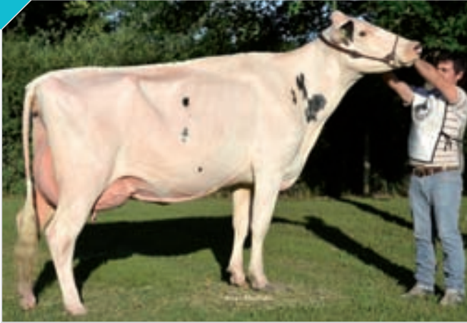
67 SAN SATURIO MARIS BAXTER TEI