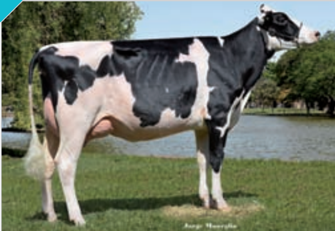
HBA 0320768 Rdo. Campeón Vaca 2 Años Junior, Rdo. Campeón Vaca Joven y Mejor Ubre Joven Canals, Rdo. Campeón Vaca 2 Años Junior La Playosa, ERICCA y Bavio, Campeón Vaca 2 Años Junior y Rdo. Campeón Vaca Joven FINACO, Campeón Vaca 2 Años Junior, Campeón Vaca Joven y Mejor Ubre Joven San Francisco. Criador y expositor: Cab. y Tamb. La Lilia SA , La Lilia.