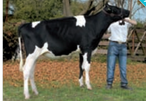
SAN SATURIO LUXMI SHADOW 332 TE 34