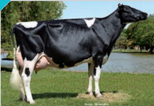
80 LA LILIA BABY ANGIE JASPER TE

HBA 0311907 Rdo. Campeón Vaca 4 Años Canals, Bavio y MIL, Campeón Vaca 4 Años, Gran Campeón y Mejor Ubre ERICCA y San Francisco, Campeón Vaca 4 Años y 3er. Mejor Hembra Rafaela. Criador: Cab. y Tamb. La Lilia SA, expositor: Cab. y Tamb. La Lilia SA, Mundo Gen y C. Andreoli.