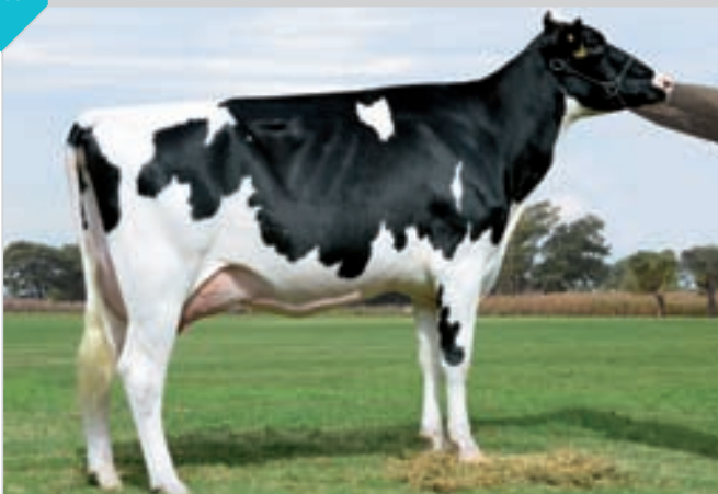
65 NININ JACKIE 3 GOLD SHOTTLE TE