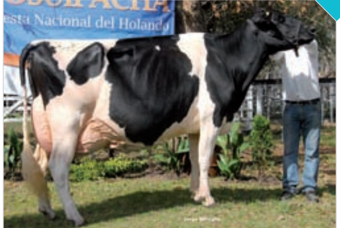
HBA 0298397 Campeón Vaca Vitalicia y 3er. Mejor Hembra Fiesta Nac. del Holando. Criador y expositor: Lorentor SA , Alicia.