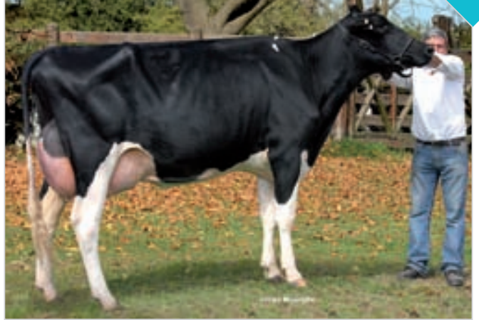
LUYDA 304 ASTRID 107 SANCHEZ TE

HBA 0315772 Campeón Vaca 3 Años Senior Fiesta Nac. del Holando. Criador y expositor: San José de Poblet S.H. , San José.