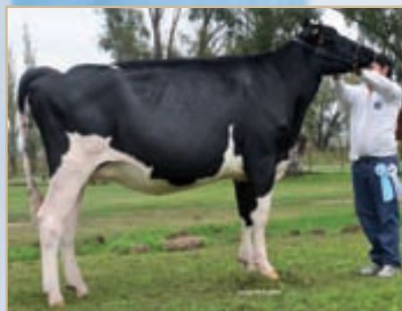
Campeón Vaquillona Intermedia Villa María otoño.