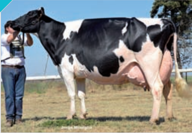
HBA 0303686 Campeón Vaca Vitalicia y Rdo. Gran Campeón Canals, Rdo. Campeón Vaca Vitalicia Rafaela, La Playosa, ERICCA, Campeón Vaca Vitalicia FINACO, Bavio, San Francisco y MIL. Criador y expositor: Cab. y Tamb. La Lilia SA , La Lilia.