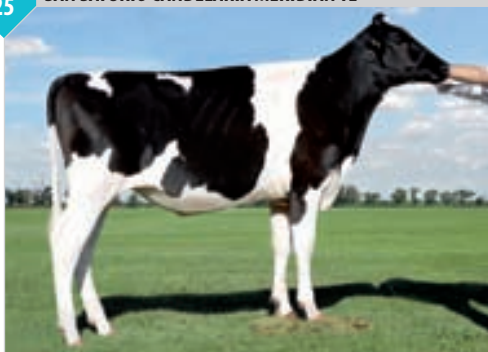
SAN SATURIO CANDELARIA MERIDIAN TE