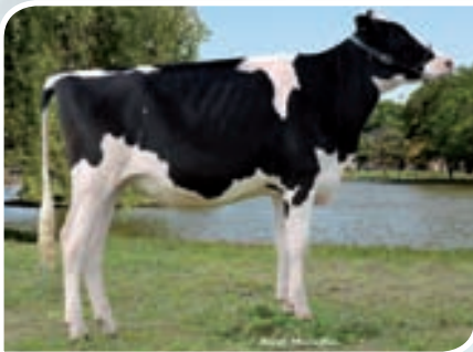
SAN SATURIO LEXA ATWOOD TE