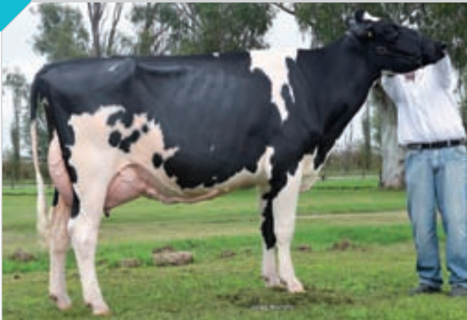
78 GAJC LATINA SHOTTE LICORICE TE