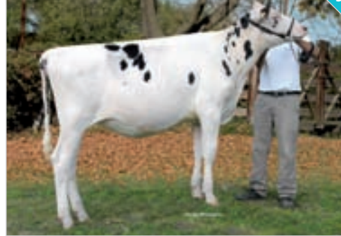
GAJC RAPUNZEL MCCUCHEN BAHIA TE 32