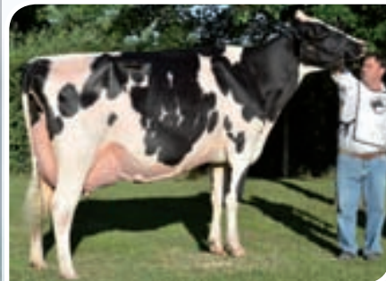
SAN SATURIO LERIDA LITORAL