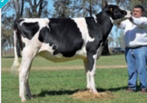
33 DON MINGO ALTARIA 5013 ATWOOD TE