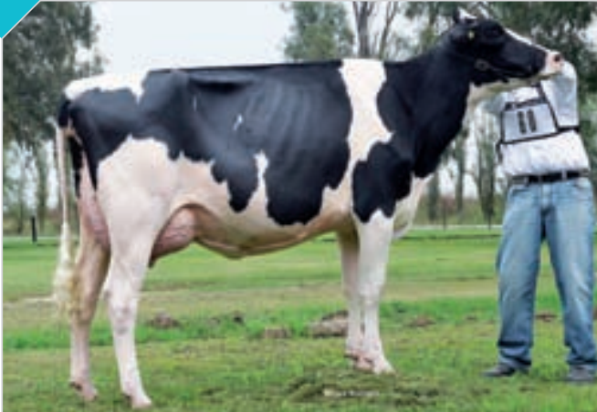
HBA 0321182 Campeón Vaca 2 Años Junior y Campeón Vaca Joven Fiesta Nac. del Holando y Villa María otoño, Campeón Vaca 2 Años Junior Palermo y Rafaela. Criador y expositor: Agramin SA , La Vigilancia.